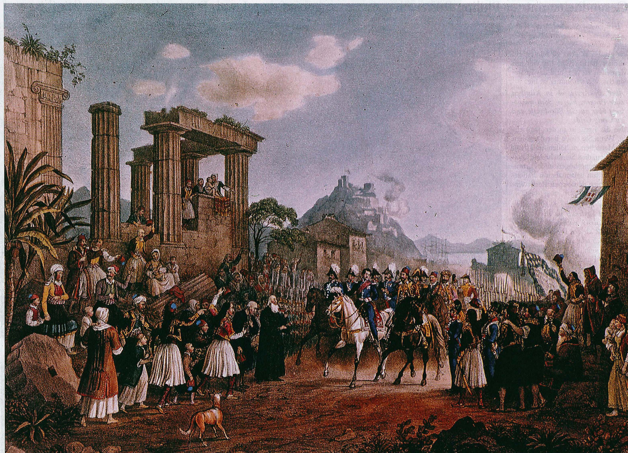
Das Vorbild: Von 1832 bis 1862 regierte der Wittelsbacher Otto von Bayern (auf dem Schimmel) in Griechenland. Er hielt das Land zahlungsfähig, indem er eine Anleihe auflegte.

Natürlich wird gegen diesen Vorschlag eingewendet werden, dass die griechische Bevölkerung keine deut-